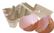
Coquilles & boîtes d'œufs (écrasées et en morceaux)