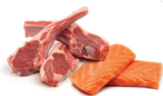
Déchets de viandes et poissons crus